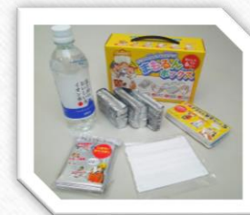
まもるんボックス画像