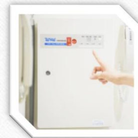
非常用通報装置画像